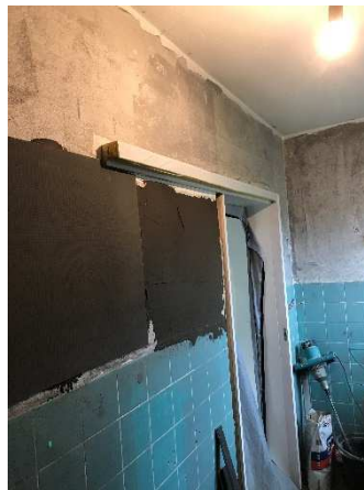
Badzimmer während des Umbaus