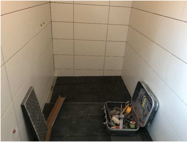
Badzimmer während des Umbaus