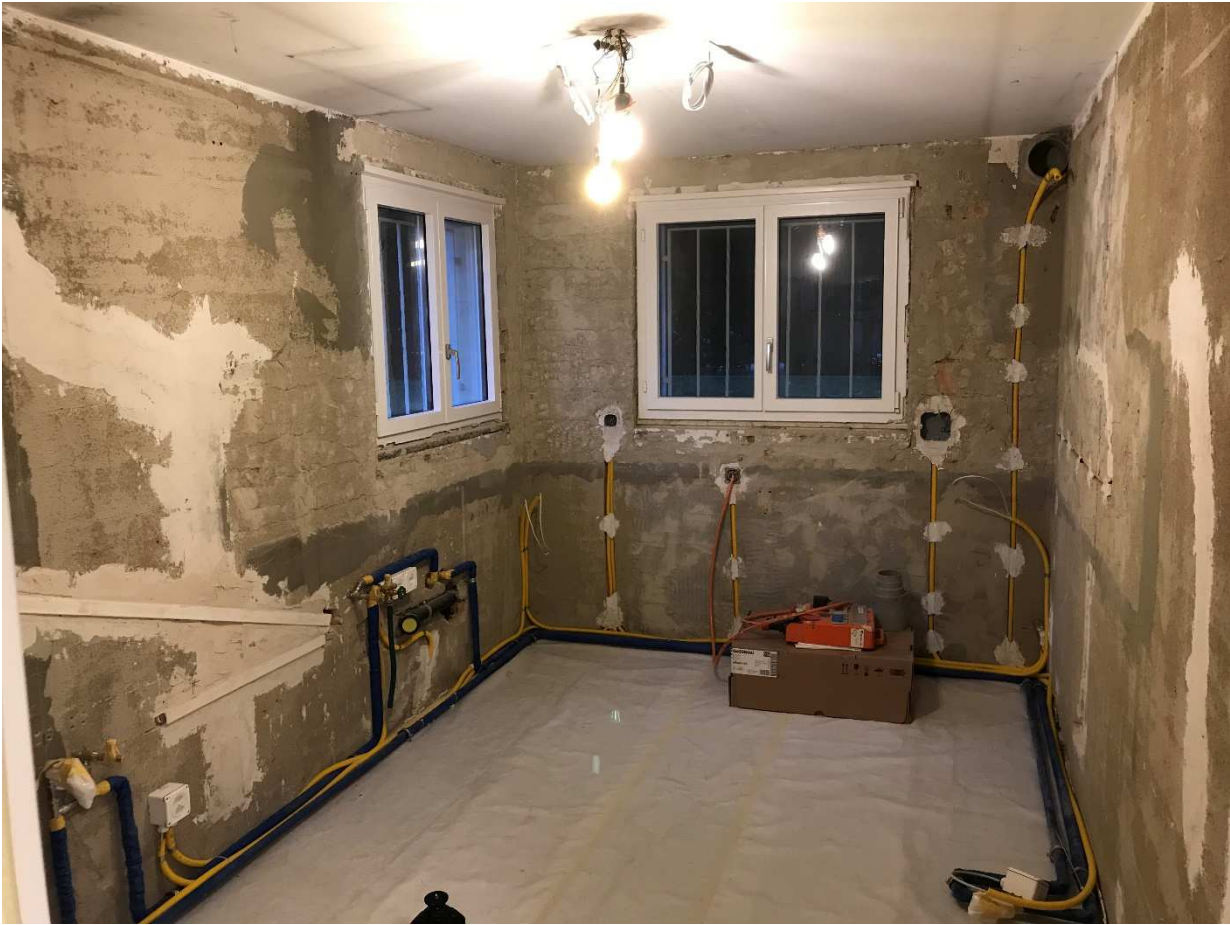
Während der Sanierung